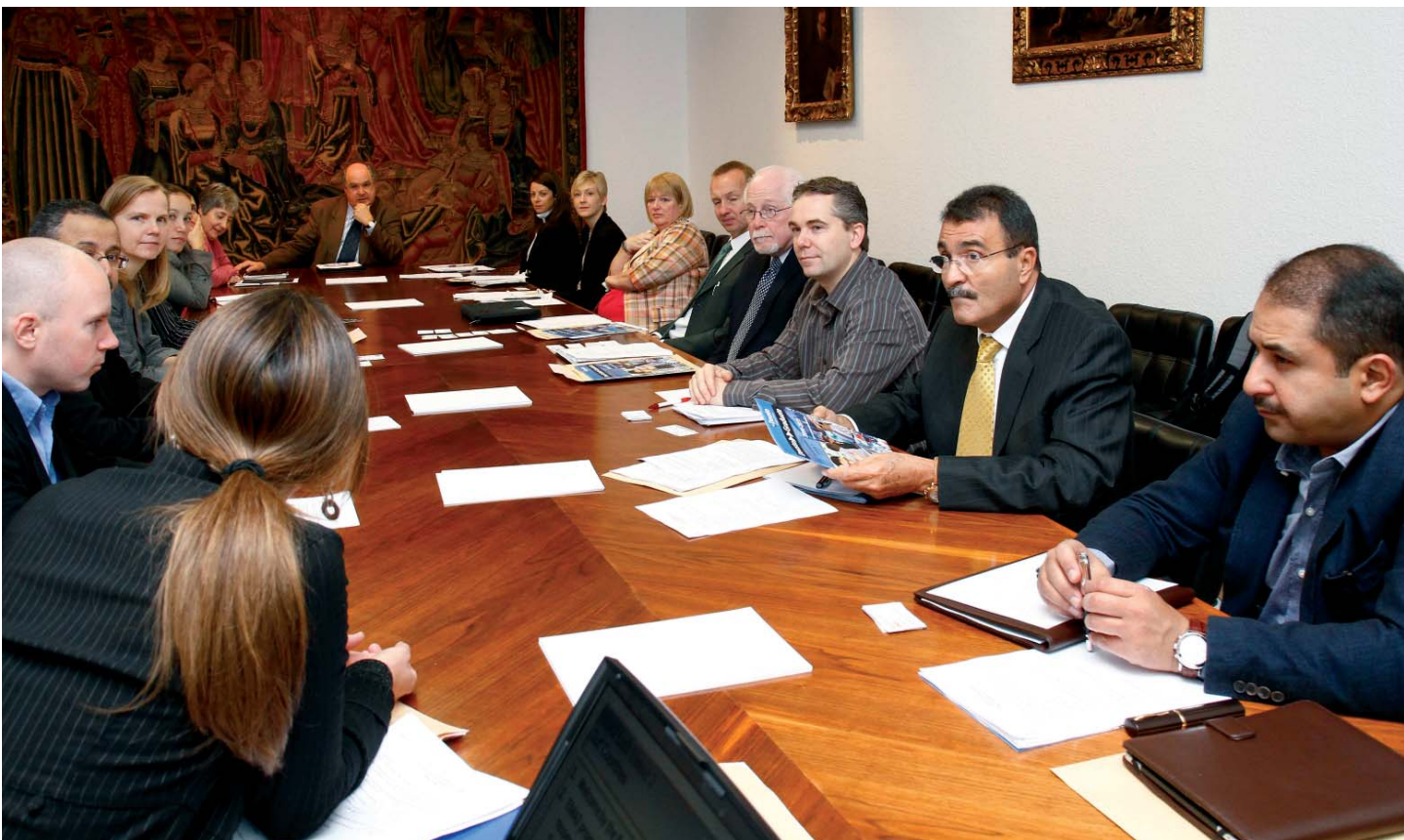
Reunión de trabajo con el Rector para sentar las bases de la colaboración entre Deusto y los países del Golfo