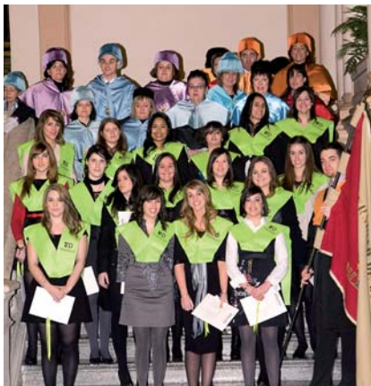
Diplomadas de Secretariado de Dirección el día de su investidura