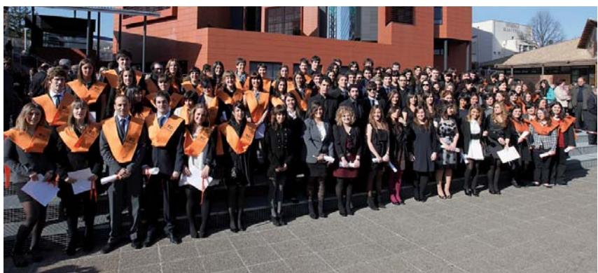
Nuevos titulados de Ciencias Sociales y Humanas de San Sebastián