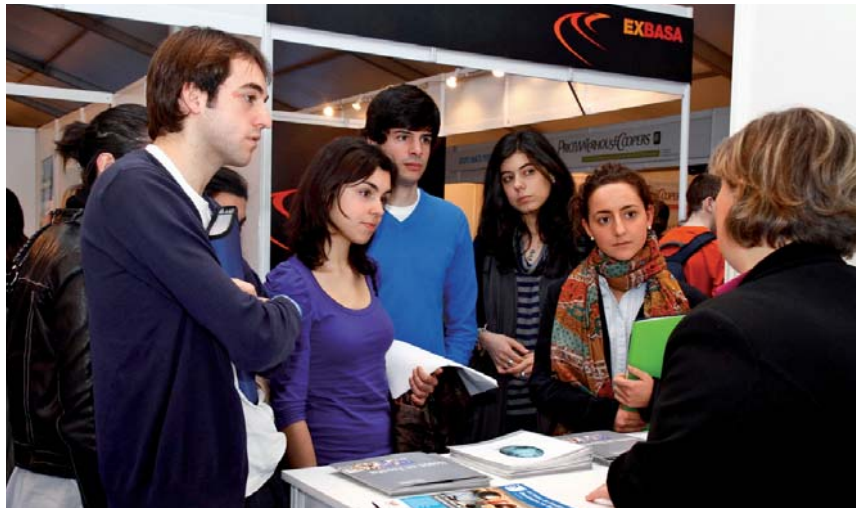
Estudiantes se interesan por las posibilidades de empleo durante el Foro del año pasado