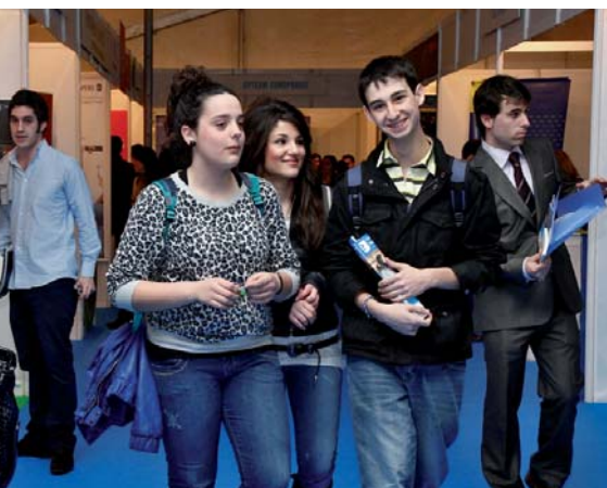
El Foro se ha constituido como una verdadera cita con el empleo para los estudiantes