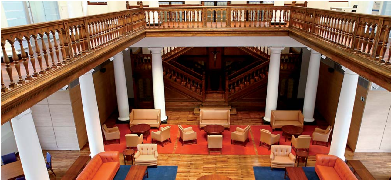
Deusto celebró el 12 de abril la inauguración del nuevo edificio de La Comercial. En la imagen, el Faculty Club

En la antigua Biblioteca, se ha creado un Faculty Club, un lugar de reunión típico de las grandes instituciones anglosajonas, como Harvard, Yale y Oxford