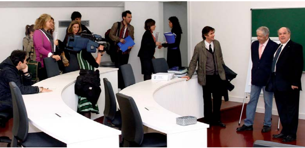
Un nuevo momento del encuentro con los periodistas para conocer con detalle las aulas para la formación executive de Deusto Business School

lo nuevo ha sido lo más valioso de la obra. Me ha gustado mucho trabajar con un edificio histórico y devolverlo a la juventud».